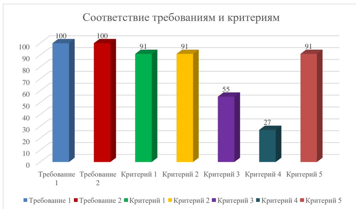
Диаграмма 1. Результат проверки по требованиям и критериям итогового тренировочного сочинения (изложения) обучающихся 11-х классов

Представленные выше таблица и диаграмма позволяют увидеть, что не все обучающиеся 11-х классов, которые присутствовали на испытании, получили «зачет» за работу. Из 11 обучающихся 10 человек получили зачет по сочинению (91%), 1 человек – незачет (9%). Наибольшие трудности у обучающихся вызвали критерии 3 и 4. Критерий 4 получил критически низкий процент соответствия.